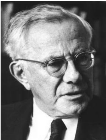
Paul Tillich (1886 - 1965)

Een kennis vertelde mij het boek 'De Moed om te Zijn' 1 van Paul Tillich kocht te hebben toen ze dit toevallig zag liggen in een boekhandel in Utrecht. Deze mededeling was uiteraard niet bedoeld als een neutrale mededeling maar als een uitnodiging om een reactie te geven op haar impulsieve aankoop. Wat te antwoorden? Even was er de verlegenheid, maar tot mijn eigen verrassing vond ik in mijn kast, bij enkele inleidingen over Tillich een uitgave van dit werkje uit 1963.